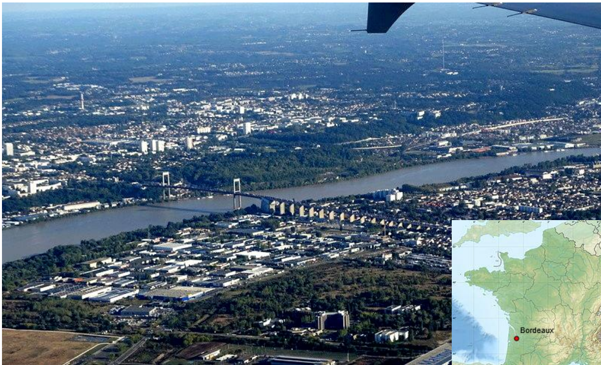
Vue de Bordeaux par avion