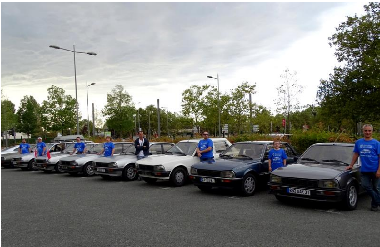
Les PEUGEOT 505 présentes lors de ce weekend (photo prise avant la visite de Bordeaux le samedi après-midi)