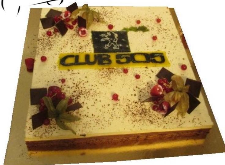
Le gâteau des 10 ans !