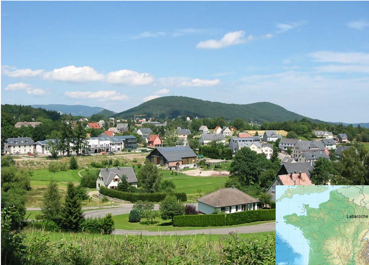
Vue Générale de Labaroche