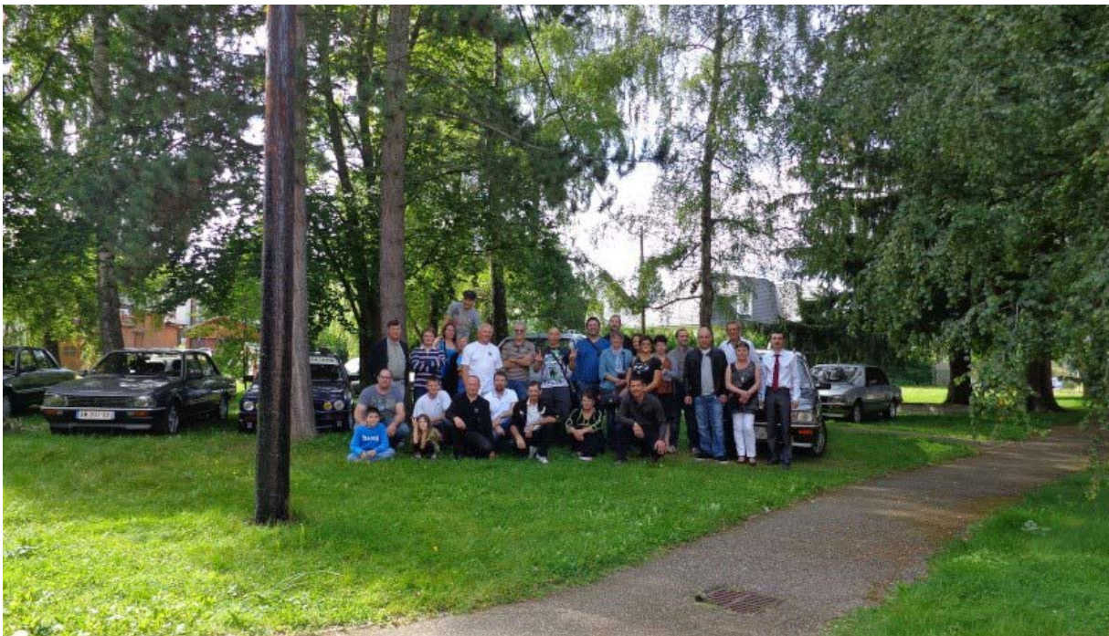
Les membres et les sympathisants avec leurs PEUGEOT 505 présentes lors de ce weekend